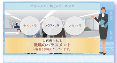
▲ コンテンツ動画のイメージ ～ Part.1 職場のハラスメントとは～

受講環境は、PC、タブレット、スマートフォンなど、機器やブラウザの制限がなく、いつでもどこからでも、ご自身で時間を取ってご受講いただけます。それぞれのパートが約16分で完結するので、長時間、仕事から離れることなく受講ができるのもポイントです。（全体で約50分）